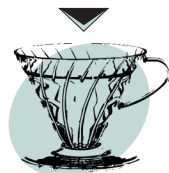
V60 6,50 - 7,00