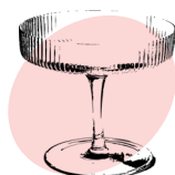
Espresso Martini Dubbele espresso, wodka & Kahlúa 9,95